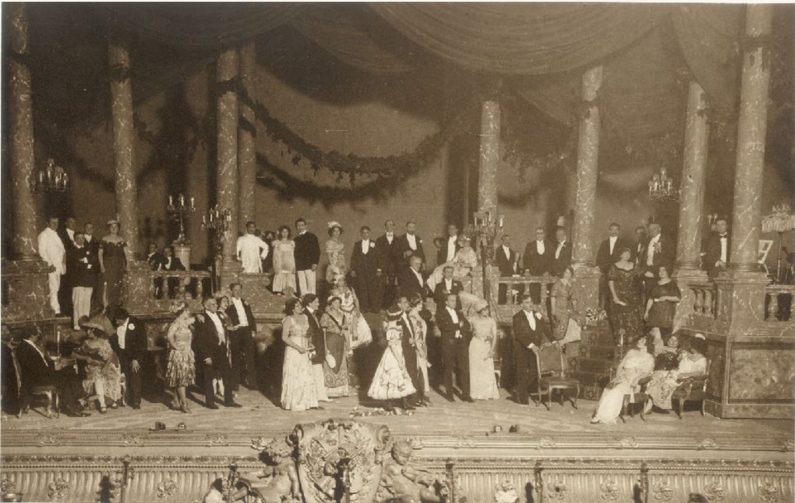
Fotografie z premiéry opery Vzdálený zvuk ve Frankfurtské opeře 18. srpna 1912.