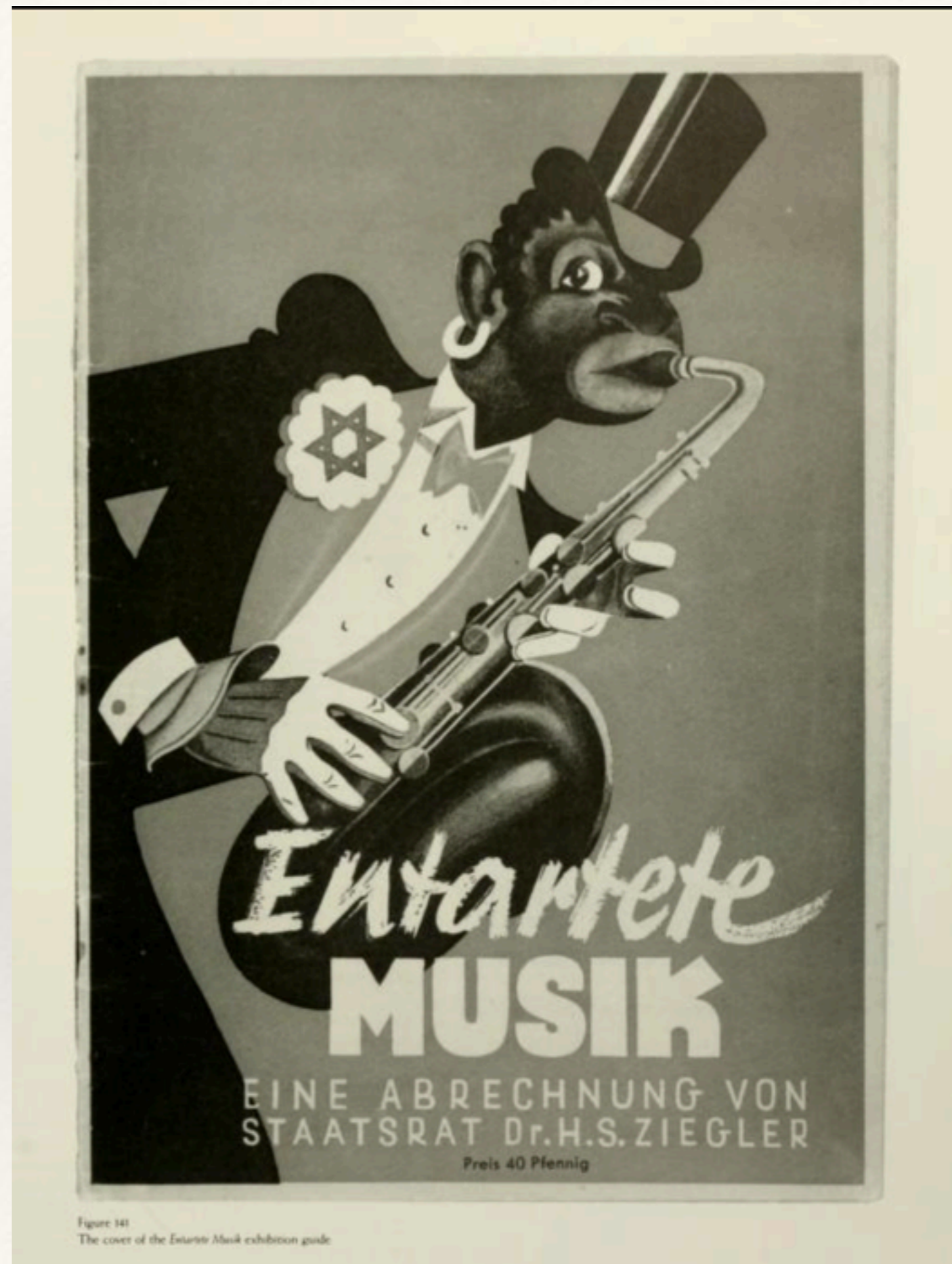
Figure 141 The cover of the Entartete Musik exhibition guide

Motiv k plakátu opery Jonny spielt auf Schrekerova žáka Ernsta Krenka. Jeden z hlavních exponátů výstavy „zvrhlé hudby“ v roce 1938 v Düsseldorfu.